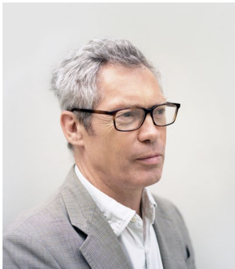
ジャスパー・モリソン, 2012