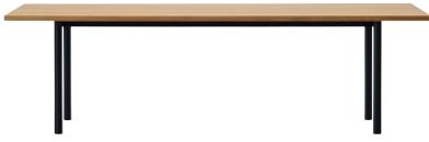
ダイニングテーブル [スチールレッグ] 180, 200, 220, 240, 320